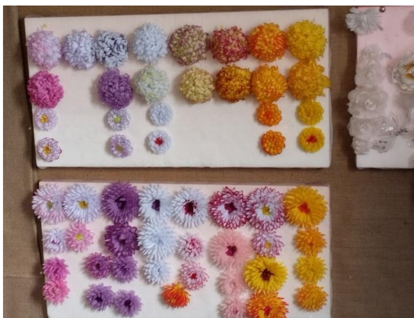
Květiny vyrobené z papíru

Vysekávacím strojem se z papíru vysekne tvar dané květiny. Poté se papír prokropí lihem a vodou. Nakropené výseky se nechají několik dní proležet. Nadále se výsek probarvuje různými barvami dle přání zákazníka. Po odležení a dostatečném usušení se dále zpracovává na stroji. Jedním z těchto strojů je tzv. karusel , který tvaruje plátek květin teplem a tlakem. Po vylisování vzniknou takzvané pompony nebo jiřiny. Poté se na lisu sešijí plátky a vznikne květina. Pro delší životnost se dále papírové květiny voskují. Druhou možností ve způsobu výroby je stroj zvaný rýfkovačka tvarující květiny velkým tlakem. Po vylisování vzniknou takzvané chryzanty. Po navlečení se také voskují.