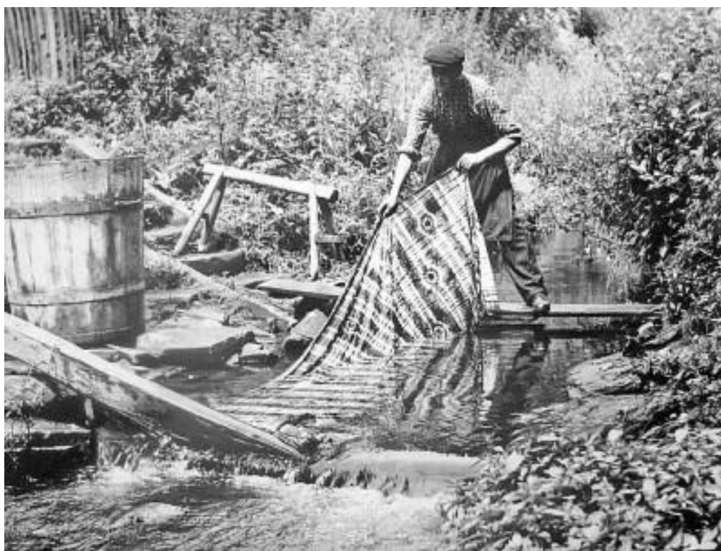
Praní na potoce

Výroba modrotisku spočívá v ručním tisku vzorů odpuzující hmotou na plátno a jeho následné obarvení v přírodním modrém barvivu zvaném indigo. Je to první cílevědomá technika zdobení textilu (tzn., že již před barvením zná barvív výsledek). Původně se k barvení používal len, který se v kraji pěstoval a zpracovával, později jej nahradila bavlna. Technika zdobení spočívá v nanesení tiskařské hmoty, papu (hmoty podobné vosku) pomocí forem z hruškového nebo švestkového dřeva na plátno (jako razítkem) a jeho následném obarvení. K barvení se používá indigo, barva rostlinného původu. V místě, kde byla nanesena tiskařská rezerva se barva nedostane k vláknu. Po dobu několika hodin je látka v potřebných intervalech nořena do tzv. kypy, dva metry hluboké kádě zapuštěné do země, s lázni z indiga. Po vyjmutí se látka namočí do kyselého roztoku, který rozpustí tiskařskou rezervu a zároveň ustálí indigo. Látka je po uschnutí vymandlována, čímž se docílí hladkého a lesklého vzhledu modrotisku.